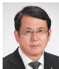
田中 正規 ガバナー