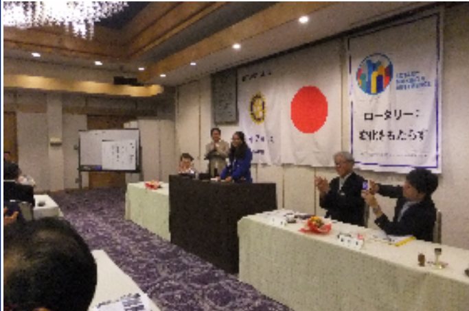
ノートを見ながら上手に挨拶してくれました☆