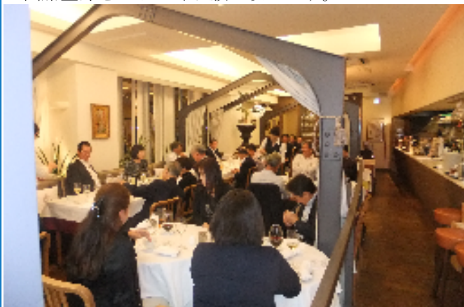
ラ・バルカの様子

次の事業は12月1日のクリスマス家族会です。お早目の出席登録をよろしくお願い致します。