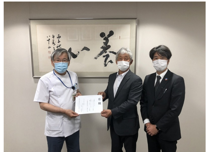
稲沢市民病院 ハンドジェル 200本/フェイスシールド 100枚