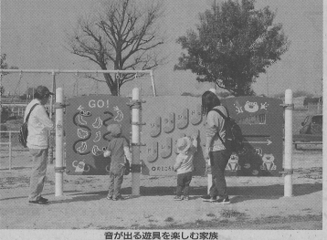
音が出る遊具を楽しむ家族

稲沢ロータリークラブは、市のインクルーシブ遊具設置に協力した。クラブのメンバーは、遊具の設置現場を訪れ、作業をサポートした。これは、地域の福祉向上に貢献する取り組みの一環である。