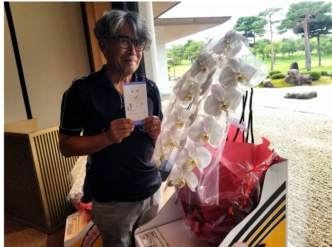
優勝おめでとうございます！