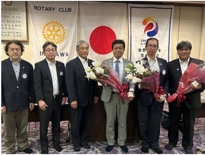
1年間ありがとうございました